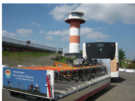
Elbe-Radwanderbus am Lüheanleger